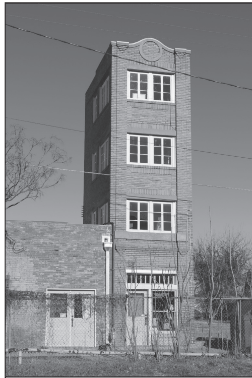
El edificio Newby-McMahon es llamado el rascacielos más pequeño del mundo.

3 Ahora, el edificio atrae a turistas. Los sitios web de viajes lo llaman "¡una visita que no debe perderse!" Ha sido declarado Monumento Histórico de Texas. Es gran cosa para un rascacielos diminuto.