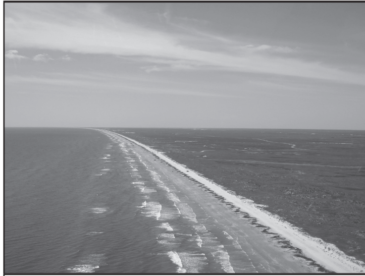
El Parque Nacional Isla del Padre

Completa el organizador agregando detalles de apoyo.